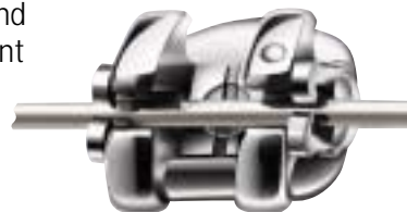
Bracket mit Bogen

Der Clip im Bracket ist intelligent – er gibt den Draht bei hoher Krafteinwirkung frei. Dies ist eine wichtige Schutzwirkung für die Zähne. Dadurch werden sie schonend und trotzdem höchst effizient und vorhersehbar in die richtige Richtung bewegt.